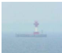
Der Kieler Leuchtturm für das Leuchtturmprojekt in Bayern

Anmeldung / Antwort nur per Fax DAS - IB GmbH 0431 / 2004137